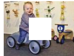
SPIELZEUG So spielt der Playboy von morgen