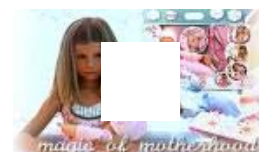
BIZARRES SPIELZEUG Mit dieser Puppe lernen Kinder das Stillen