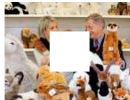
SPIELZEUG-MANUFAKTUR 100 Jahre Kuscheln in Kösen