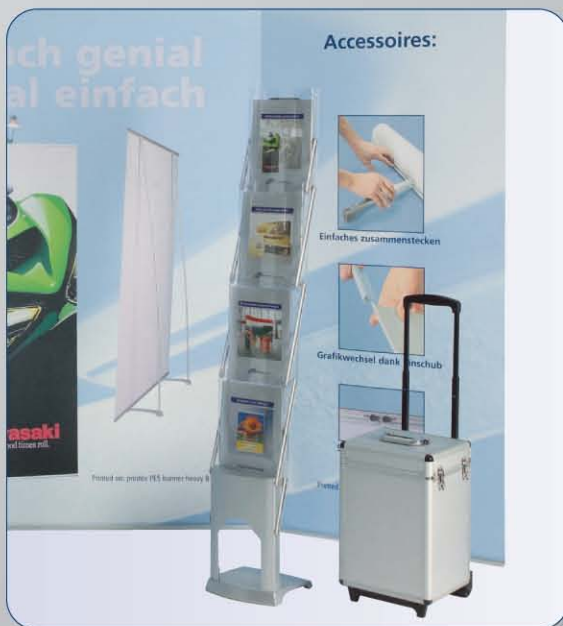
Expolinc Brochure Stand wahlweise mit Hardcase oder Nylontasche