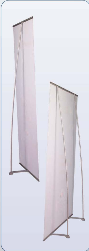
In der XL-Version bis zu 5 qm Fläche

4-screen Classic ist ebenso leicht wie standfest. Dank seines geringen Gewichts bleiben Sie mobil und flexibel. Dabei garantieren ausgesuchte Materialien und pfiffige Details die Stabilität und Zuverlässigkeit Ihres 4-screen Classic. Wählen Sie zwischen sieben Breiten von 55 bis 200 cm und vier Höhen von 150 bis fast 250 cm.