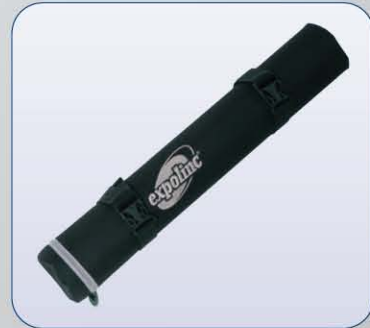
Die Transporttasche für die Strahler lässt sich bequem am 4-screen Classic-Köcher befestigen