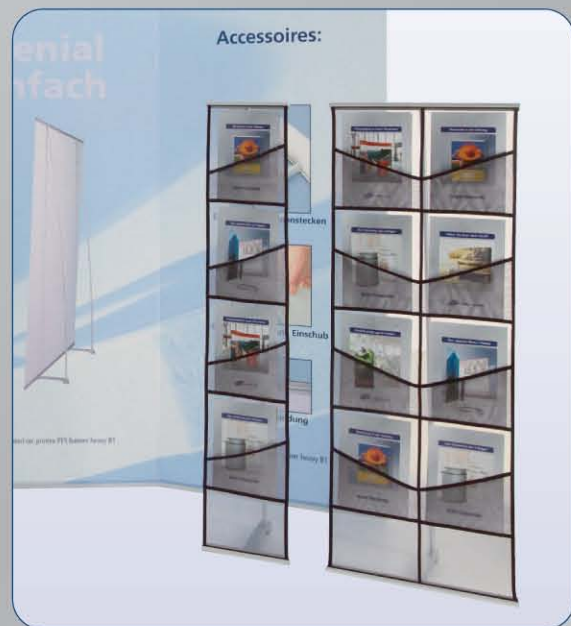
4-screen Classic Prospektständer mit vier oder acht DIN A4 Fächern