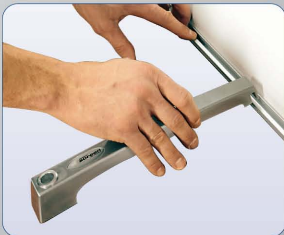
Fuß und Stange sind in Sekundenschnelle ohne Werkzeug zusammengesteckt

Exklusive Qualität mit Lifetime-Garantie und einem unschlagbaren Preis-Leistungs-Verhältnis.