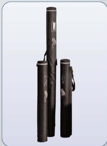
Gut geschützt mit den Transporttaschen