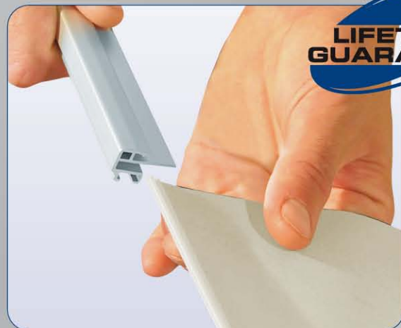
Die Einschubtechnik ermöglicht einen schnellen Grafikwechsel