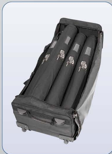
Das Multibag fasst bis zu neun 4-screen Classic Systeme bis max. 85 cm Breite.